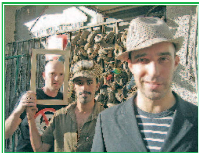
Eine der Facetten des diesjährigen Länderschwerpunktes USA: „Balkan Beat Box“ Welche musikalischen Einflüsse, die unterschiedlicher nicht sein können, in dieser Band fulminant vereint sind - das muss man einfach live miterleben.

Das Team des christlichen Kindergartens „Baum des Lebens“ bietet während der Festivaltage einen Kinderbetreuungsservice an. TFF-Besucher mit Kleinkindern ab einem Jahr können ihren Sprösslingen also auch mal eine Auszeit bei Spiel und Erholung in der neuen, modern ausgestatteten Einrichtung gönnen. Das Angebot kann stundenweise zur Tag- als auch Nachtzeit genutzt werden. Der Kindergarten „Baum des Lebens“ befindet sich zentrumsnah in der Mitte der Großen Allee. Presse/ÖA