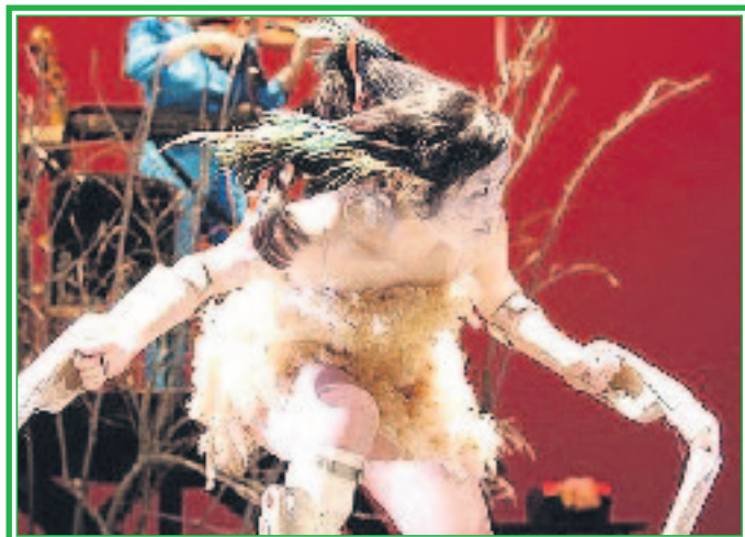
Passst in keine Schublade: Das „Degenerate Art Ensemble“ bringt mit ihrer Multimedia-Performance jeden zum Staunen.

Ja, es ist wahr - die raue, italienische Röhre tritt Samstag-Nacht im Heine-Park auf. Mit ihrer Rockband und dem aktuellen Programm „Grazie“ tourt Gianna Nannini durch Europa und macht dabei auch in Rudolstadt Station.